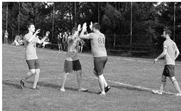
Duel na Klínci a radost po vstřelené brance do sítě domácího celku.