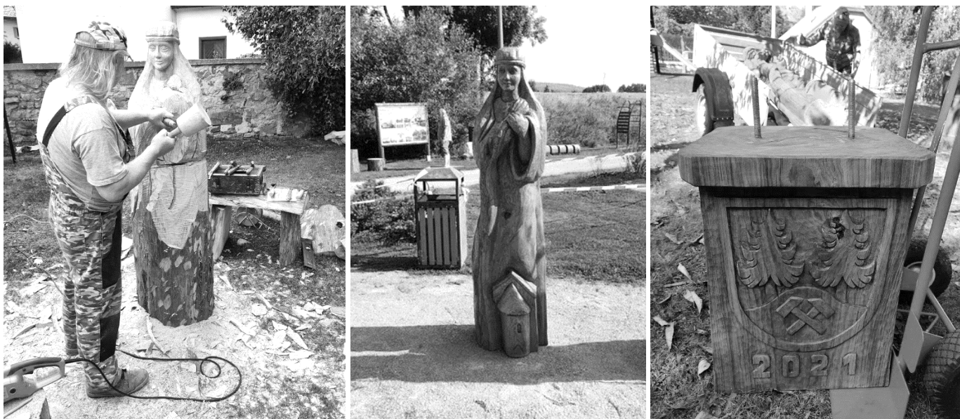
Tvorba sochy sv. Ludmily pro Zahořany na sochařském sympoziu v Kytíně.

Pomocí několika fotografií si ukážeme, co nového najdete nyní v Zahořanech a jak se tvořila socha sv. Ludmily na sochařském sympoziu v Kytíně.