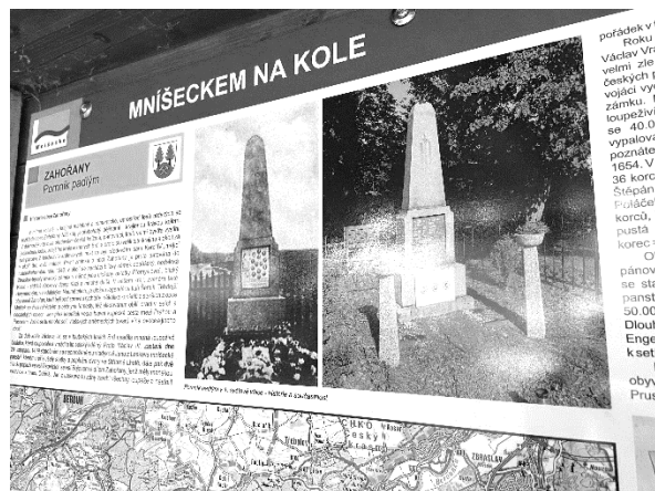
Nové infotabule s vyznačenými cyklotrasami „Mníšecko“. Svatý Václav a Pomník padlým v 1. sv. válce.