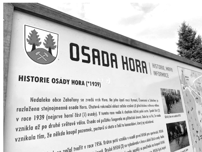
Infotabule Osada Hora, kde najdete text o historii osady, mapu a prostor pro sdílení informací.