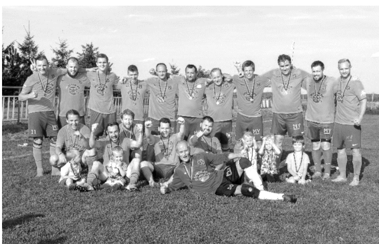
Pozápasové oslavy s fanoušky a týmové foto s medailovou odměnou.