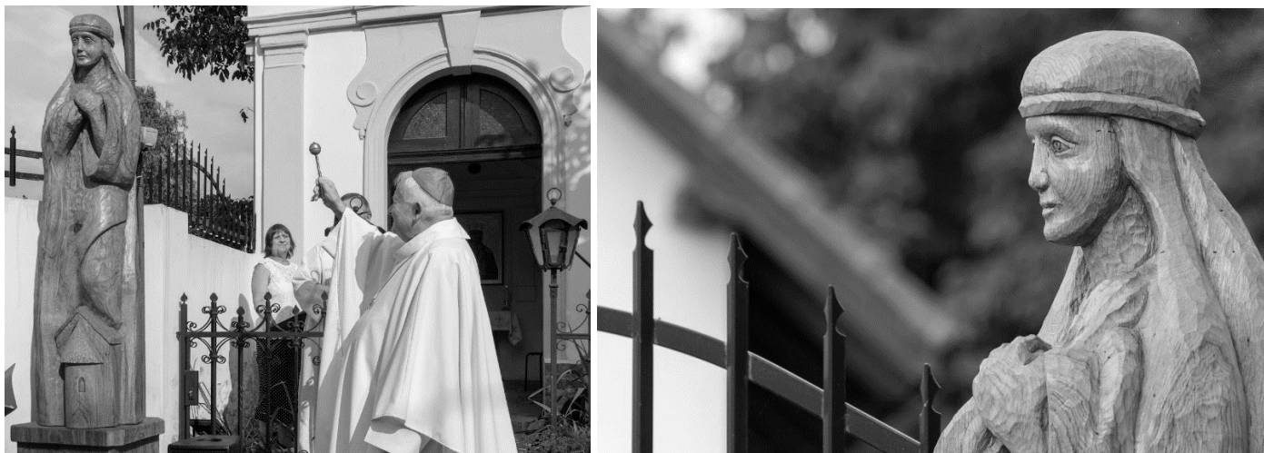
Vysvěcení kaple sv.Ludmily a dřevěná socha sv.Ludmily před kapličkou.

V letošním roce slavíme 1.100leté výročí mučednické smrti svaté Ludmily, babičky svatého Václava, který má na nedalekém vrcholu Pleš svůj památník již od roku 1936. Proto jsme se rozhodli zasvětit naši zahořanskou kapličku právě této české světici a svatou Ludmilu tak učinit patronkou naší obce.