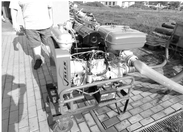
Foto hasičských stříkaček po generálce