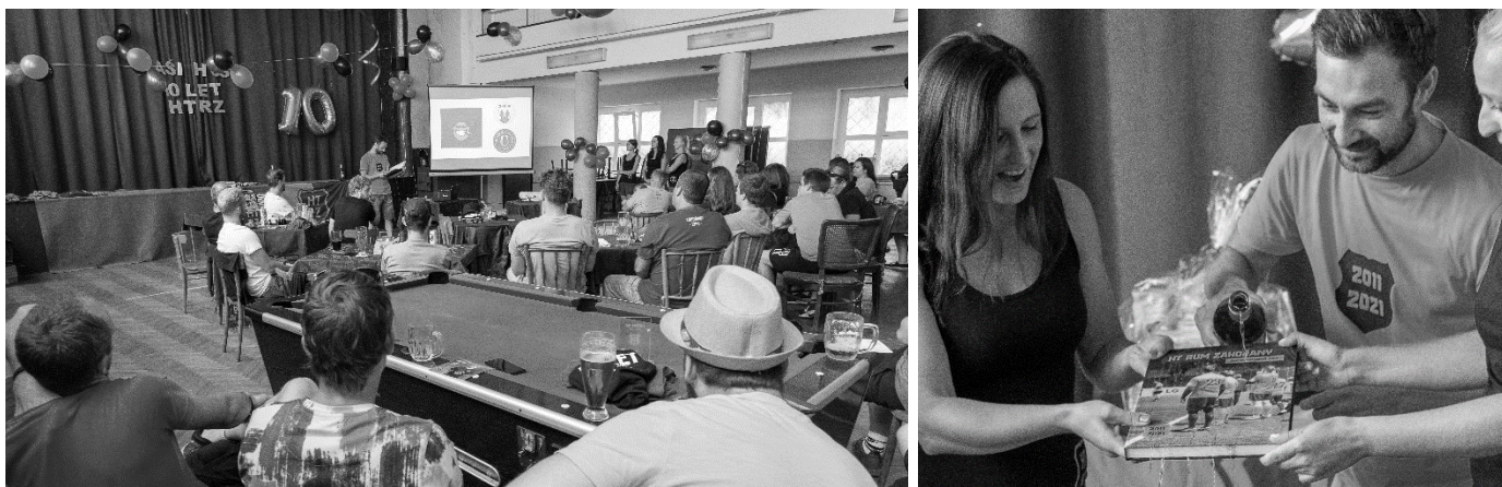
Prezentace na sále hostince U Pepíčka a křest knihy „Bož(kov)ským“ nápojem

Je to již dlouhých 10 let, kdy se parta lidí ze Zahořan sešla v hostinci U Pepíčka a myšlenku založit fotbalový klub přetavila v realitu. V roce 2011 to vypadalo jen jako jeden z hospodských nápadů. Postupem času se ale naše působení v Hanspaulské lize stávalo důležitou součástí nejen naší party, ale rovněž i života v Zahořanech. Ve stejném roce jsme společně uspořádali zároveň 1.ročník turnaje Rum Zahořany CUP, který se letos hrál již po jedenácté.