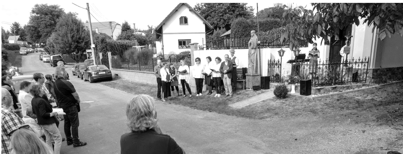
Vysvěcení kapličky na kapli sv. Ludmily a umístění dřevěné sochy.