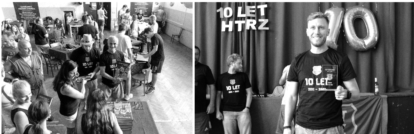
Přebírání knih a vyhlášení nejlepší sestavy uplynulého 10ti letí.

Dne 17.července 2021 jsme se k příležitosti oslav 10 let sešli na sále hostince U Pepíčka. Na programu byla prezentace shrnující celých 10 let našeho dosavadního působení a připomenutí základních milníků historie. Součástí oslav bylo vyhlášení nejlepší sestavy 10 let a také část na kterou všichni už dlouho čekali. Poslední rok vedení týmu pracovalo na sepsání knihy. Kniha, ve které se dočtete o historii založení týmu, vývoji klubových barev a loga, rozhovory se soupeři, rozhodčími a důležitými lidmi ohledně týmu a také kompletní rozpis všech sezón včetně profilů jednotlivých hráčů. Počet stran knihy se zastavil na neuvěřitelném čísle 257 stran a jak říká náš název, nemohli jsme křtít jinak než „bramborovým nápojem“.