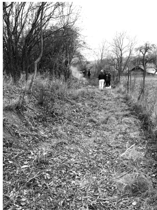
Jedna ze zahořanských brigád SDH v tomto roce.

Vážení čtenáři Zahořanských listů, příznivci hasičské myšlenky a místního hasičského sboru. Výbor sboru a členská základna SDH Vám přeje k nadcházejícím vánočním svátkům hodně pohody, rodinného štěstí a kopu splněných přání. Doba je jiná, ale vidina nového roku nás naplní očekáváním lepších dnů, kdy nebudeme žít ze strachu z nemoci, z obavy o budoucnost.